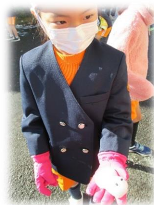
【雪だるまをつくったよ】

豊田東小学校HPには、このほか日々の学校の様子をアップしています。 こちらのQRコードから御覧下さい。